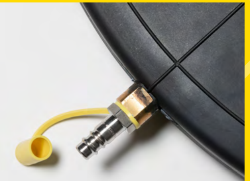
Füllanschluss im Randbereich