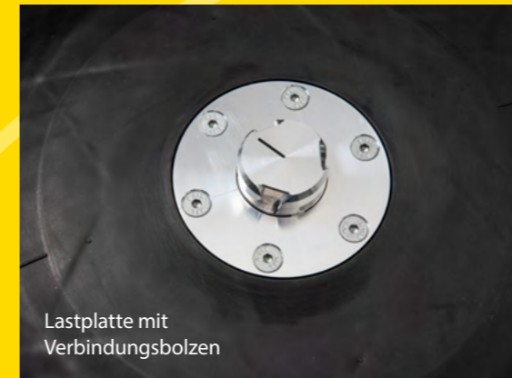
Lastplatte mit Verbindungsbolzen